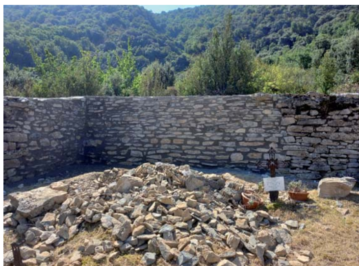
Fotografías del cementerio de Otano (arriba a la izquierda) y de la solera de la Escuela de Música (abajo a la derecha) de Noáin antes de las obras y una vez finalizadas.