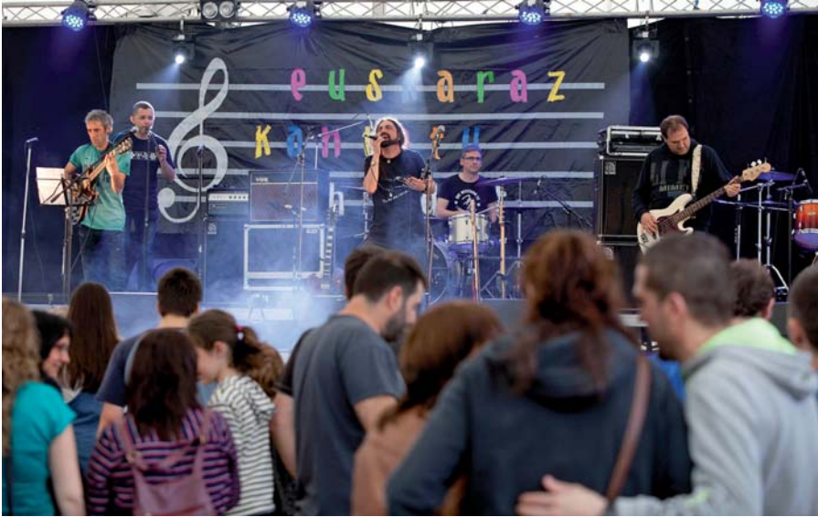
La música fue la protagonista principal de la actividad de la Gau Eskola de Elortzibar en los

últimos meses de curso. El 21 de abril tuvo lugar en el Centro Cultural la séptima edición del Euskal Kantu Jaialdia. Con las entradas agotadas desde varios días antes, por el escenario pasaron niños/as, adultos, sociedades y colectivos, familias, parejas, cuadrillas, etc.