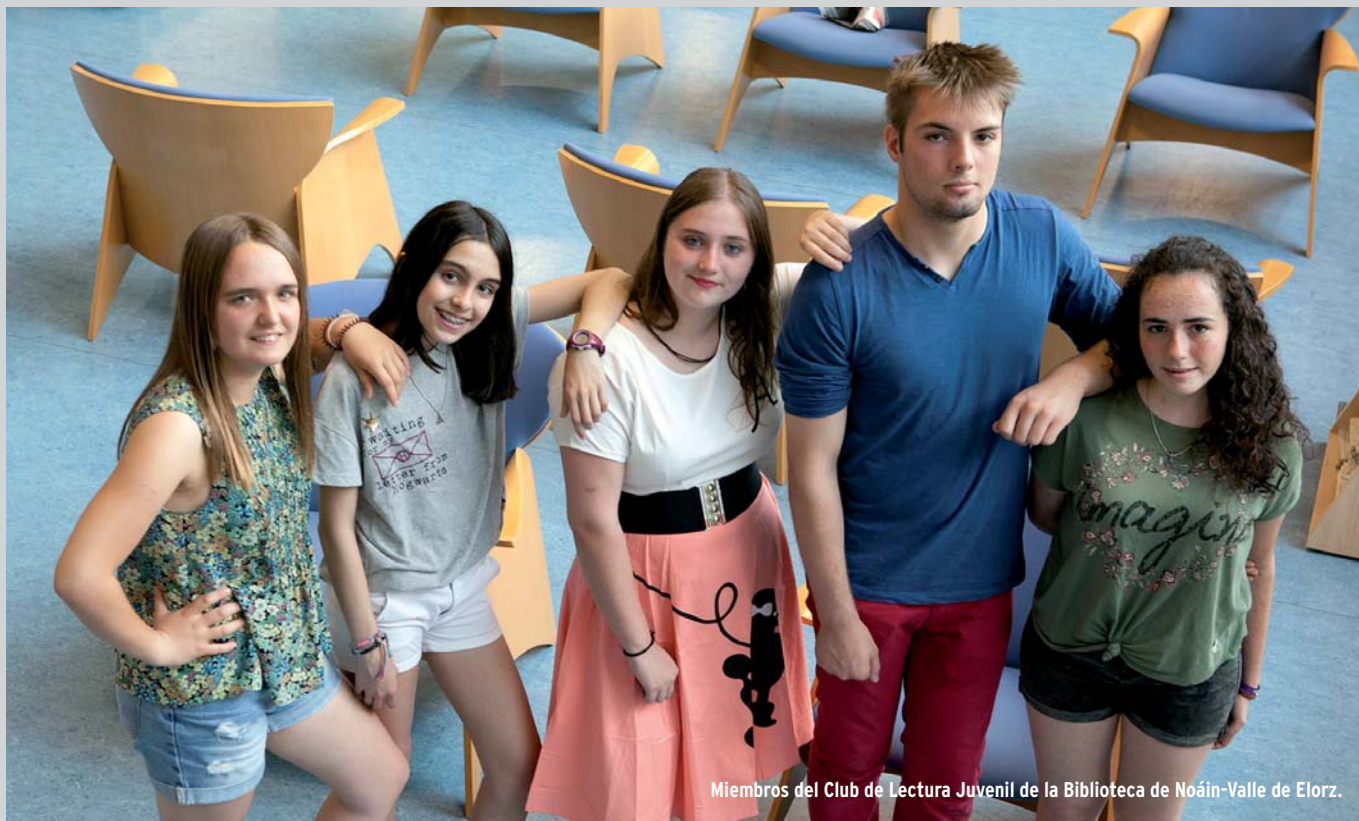
Miembros del Club de Lectura Juvenil de la Biblioteca de Noáin-Valle de Elorz.

El Club de Lectura Juvenil de la Biblioteca de Noáin ha finalizado con éxito su primera temporada. Guiados por el editor y profesor de literatura y escritura Javier García Clavel, catorce chicos y chicas han disfrutado hablando de libros.