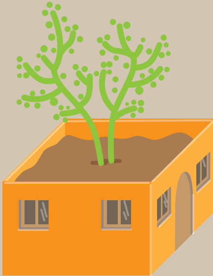
Lista obtenida de las X Jornadas de Intercambio de Experiencias del programa Hogares Verdes en el Centro Nacional de Educación Ambiental.