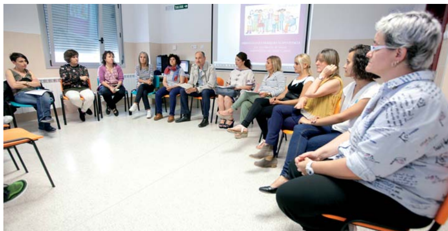
El proyecto fue presentado en el Colegio San Miguel el pasado 30 de mayo.