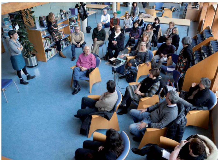
El Plan de Acción para la Igualdad fue presentado el pasado 3 de febrero en la Biblioteca Pública de Noáin.