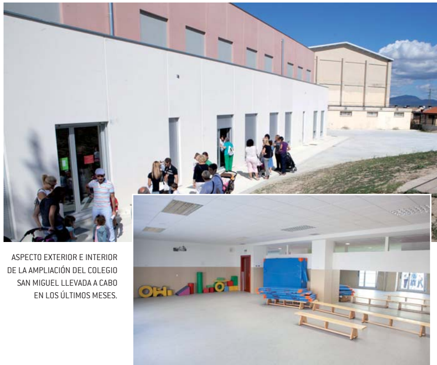
ASPECTO EXTERIOR E INTERIOR DE LA AMPLIACIÓN DEL COLEGIO SAN MIGUEL LLEVADA A CABO EN LOS ÚLTIMOS MESES.

Recordar que la primera fase de esta ampliación se llevó a cabo en verano-otoño de 2010, y en la misma se construyeron seis aulas, cuatro aseos y un cuarto de limpieza para Educación Infantil, y cuatro aulas, tres aulas de desdoblamiento y dos aseos para Educación Primaria, además de un cuarto común de instalaciones. Queda pendiente para una tercera fase sin fecha concreta la construcción de un nuevo gimnasio y sus correspondientes vestuarios.