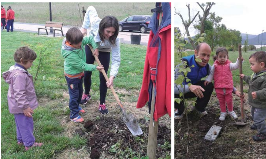
DOS IMÁGENES DE LA PLANTACIÓN REALIZADA EL PASADO 26 DE ABRIL EN IMÁRCOAIN CON MOTIVO DE LA CELEBRACIÓN DE LA CAMPAÑA MUNICIPAL “HERMANO ÁRBOL”.

El Ayuntamiento de Noáin-Valle de Elorz proporcionó el arbolado y las herramientas, y el Concejo de Imárcoain coordinó y organizó el evento en una nueva colaboración entre las entidades públicas del municipio. El objetivo de esta campaña, que se lleva a cabo cada año en Noáin y en el resto de pueblos del Valle de Elorz, es seguir tomando conciencia de la necesidad de cuidar nuestro entorno y de transmitir este mensaje a las generaciones venideras.