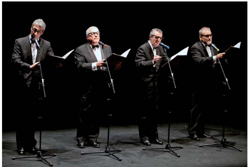
EL GRUPO DONOSTIARRA GOLDEN APPLE QUARTET LLENÓ EL SALÓN DE ACTOS DEL CENTRO CULTURAL CON SU ESPECTÁCULO DE 25 ANIVERSARIO “ÉRASE UNA VEZ LOS GOLDEN”.

E l Centro Cultural de Noáin ha registrado un gran movimiento durante el primer trimestre del año, con varios éxitos destacables en las actividades desarrolladas en el salón de actos. El patio de butacas se quedó pequeño para presenciar la actuación de los míticos Golden Apple Quartet, y también tuvo una gran acogida la proyección del cortometraje premiado con un Goya, “Minerita”, con el cineasta local Raúl de la Fuente al frente. Otros actos reseñables han sido los homenajes dedicados a Karolo Imirizaldu (ver página 20 de este boletín), con una demanda de invitaciones que desbordó las mejores previsiones. El éxito infantil de la temporada fue “Nina Calcetina”, que arrasó entre el público infantil, a la vez que los cuentacuentos siguen teniendo mucho tirón entre los más pequeños. Entre las exposiciones, ha llamado la atención la exposición de Post, con sus impactantes imágenes de buitres degustando una mesa repleta de manjares en mitad del monte.